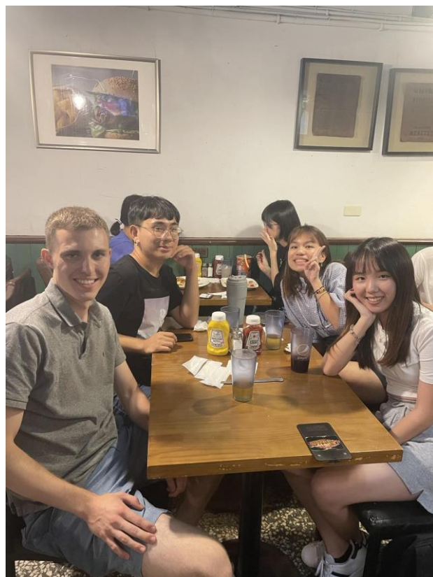
照片*2 (含文字介紹、拍攝日期及地點活動名稱)