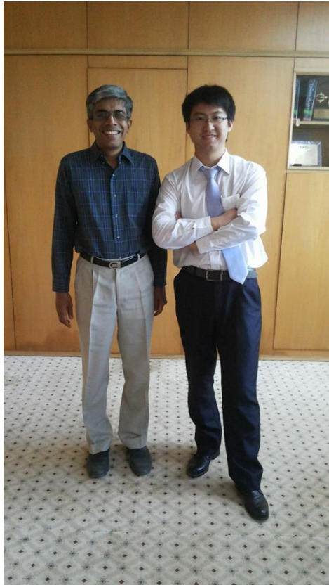
專訪“三個傻瓜” IITM 校長