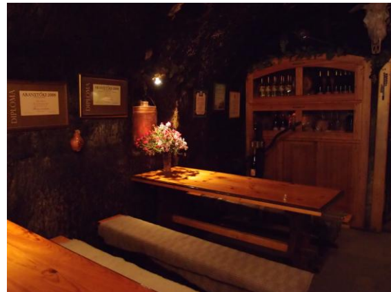
在 Eger 的小酒莊品酒

10 月時我們還去了另一個小鎮 Eger，鎮上不大但也有許多教堂跟古蹟可以參觀，附近還有一個“美人谷”是以酒莊著名的，可以從 Eger 市中心坐觀光車過去(來回大約台幣 100 元，步行單趟則需約 20 分鐘)，美人谷沿路上都是一家家的小酒莊，大約有 2,30 家，你可以大大方方的進去跟老闆說想要 Wine Tasting，老闆還會依據你的偏好(紅/白酒，偏甜/澀)推薦葡萄酒給你品嚐，不喜歡可以在問問有沒有別的酒可以試試，不過要小心不要讓自己喝醉了！當地的葡萄酒都非常新鮮好喝，價格也不貴，一公升的紅葡萄酒才台幣 100 多元，我們還看到許多匈牙利人開車載了十幾個空的大塑膠桶來買酒呢！