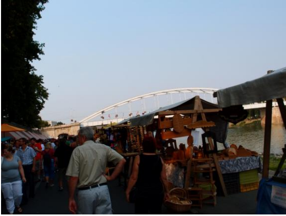
熱鬧的 Szeged 魚湯節

南部的小鎮-Szeged 念書多年的臺灣女生，我們很幸運的跟她一起參加一年一度 Szeged 魚湯節，因為匈牙利是個內陸國，魚是非常少見的食材，魚湯節可以說是小有名氣的節日，連鄰國的居民都會來參與，魚湯節僅短短 2 天，像一個在河岸邊的園遊會，可以逛逛不同特色小攤位，還有品嚐好吃的炸魚片與匈牙利魚湯，湯加入匈牙利特有的辣椒夠味但又不辣，剛喝不會非常驚艷，但喝過之後卻會很懷念那個味道！當天晚上在她家聊了一整晚和聽她精采的旅行故事，隔天還吃了道地的匈牙利小吃-Longos 當早餐(圓形的大餅類似油條的口感，上面通常會塗抹酸奶、洋蔥、起司)，最後帶著他鄉遇故知的溫暖與感動回家。