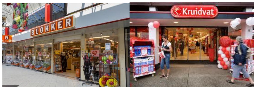
這兩家店類似台灣的五金行及屈臣氏

在荷蘭境內旅遊最方便的方法就是搭乘火車，但其實在荷蘭搭火車一趟並不便宜，如果沒有太多機會搭火車的話可以不用買需要花 50 歐的火車折扣卡(但曾有同學買過打折後的折扣卡，只要 21 歐，可以多上荷鐵網站撿便宜。)，建議可以趁一些連鎖店鋪如 Blokker、Kruidvat 和 Albert Heijn 超市販賣天票時買一些來屯，這種車票可以让你一天內搭乘火車只要花 14-17 歐，很適合想要搭火車來一日遊的行程安排。