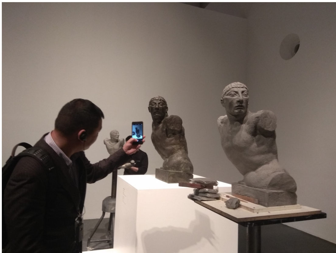
圖：現場時常有學生在一旁臨摹雕刻與原作幾可亂真的作品。

清華的理工科特別厲害，現在才知道原來美術系也是清華的重點科系之一，主要原因是清華的美術系包含了工業設計和商業設計，而這些都是現在中國許多新創企業和網路公司非常渴望的人才。地大物博的清華還在校園裡蓋了一大棟美術館，除了讓這些美術系的學生有學習發揮的舞台，也售票開放給外頭的觀光客參觀，而清華學生的福利就是拿著學生証刷卡進去“不用錢”。