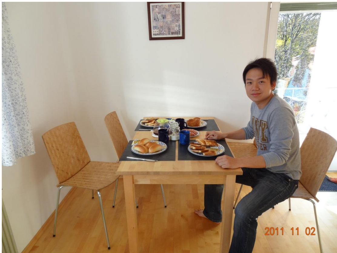
跟女生出去玩的好處，一大早起床就有準備好的早餐可以吃。