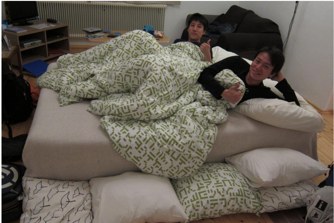
搞得有點亂，為了怕半夜睡到一半跌下去，所以在底下墊了一堆枕頭。