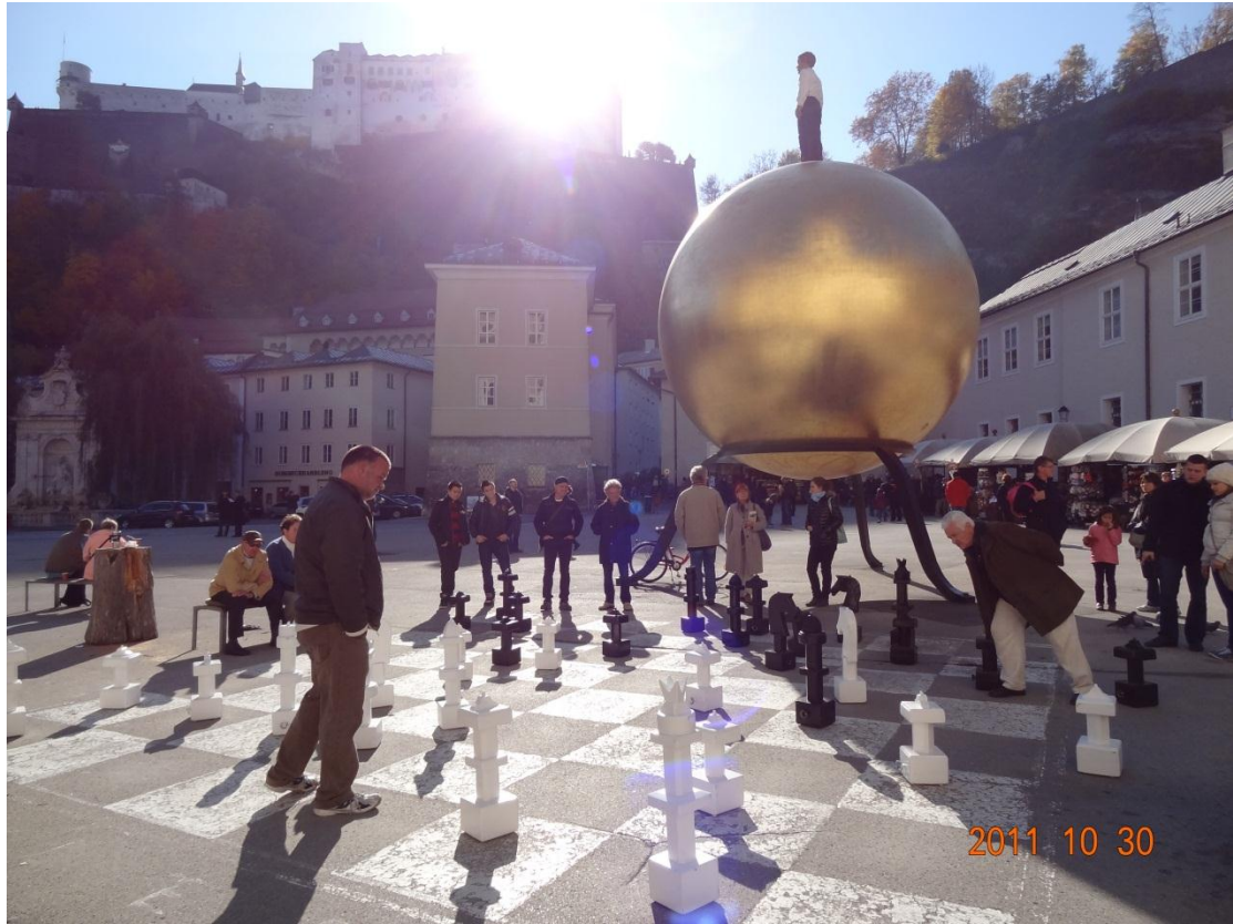
第一站我們前往的是薩爾斯堡，這張照片是薩爾斯堡下面的廣場，中央有一個巨大的西洋棋盤以及一個大金球，上面站著一位不知名的人，畫面很有趣所以拍了下來。