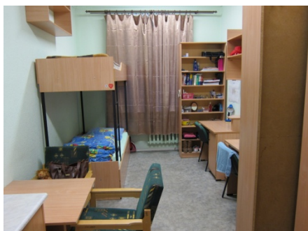
我在 sabinki 裡的房間。