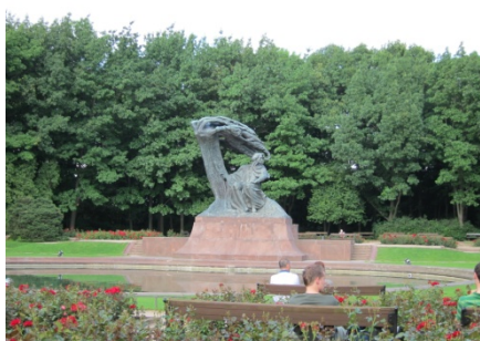
波蘭人的驕傲—蕭邦公園。

Galeria 的話，可搭和市中心反方向的 16 號電車，約 20 分鐘車程。如果要去機場的話，也是先搭電車到市中心，再轉 175 號公車就好。(也可以請 sabinki 的阿姨幫忙叫計程車，千萬不要直接到路上攔計程車，我聽過好多司機跟外國乘客亂喊價的例子，電話叫車比較有保障，坐到機場應在 20~30 波幣之間。) 電車營業到晚上 12 點，班次很多且時間固定，波蘭的站牌都有貼車輛的抵達時間，也非常的準時，真的很方便。