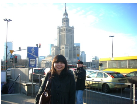
華沙的文化科學宮。