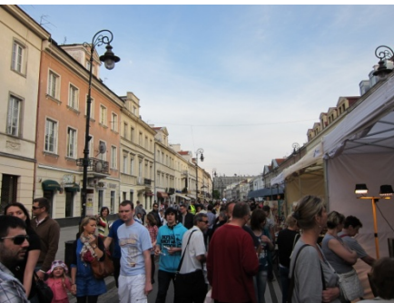
新世界大道上周末常有活動。