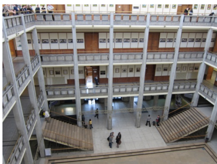
Building G 裡的天井。