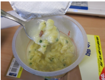
波蘭的泡麵—奶油義大利麵。