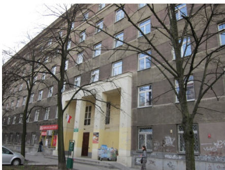
宿舍 sabinki 外觀。