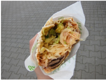
最常見的外帶食物—kebab。