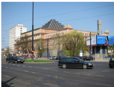
Building G 的屋頂是一座金字塔。