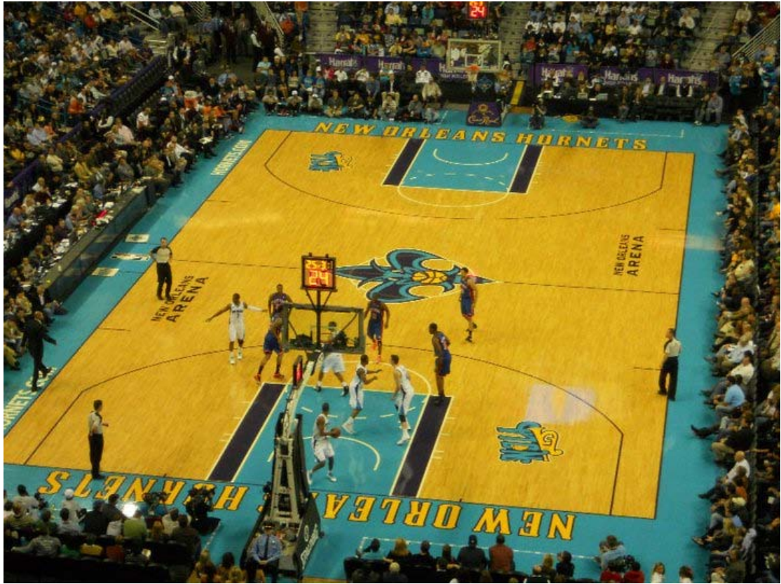
NBA New Orleans Hornets VS. New York Knicks