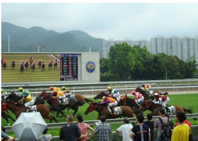
香港和日本才有的賽馬，氣氛很有趣（笑）