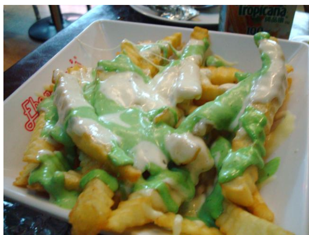
Ebenezer's Kebabs & Pizzeria 必點的芝士薯條