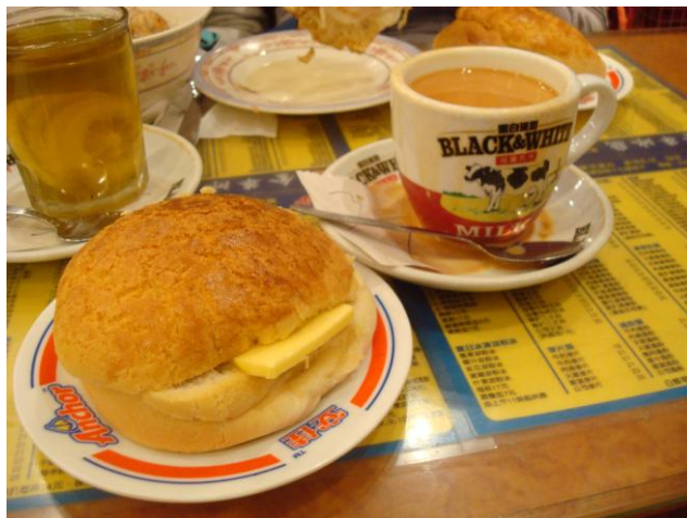
金華冰廳招牌的菠蘿油和奶茶