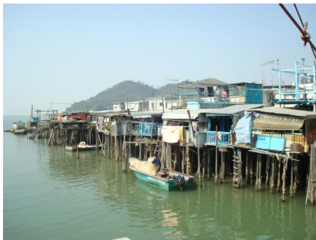
大澳漁村造型獨特的棚屋