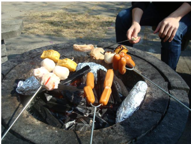
香港 BBQ 是將食物串在鐵叉上烤