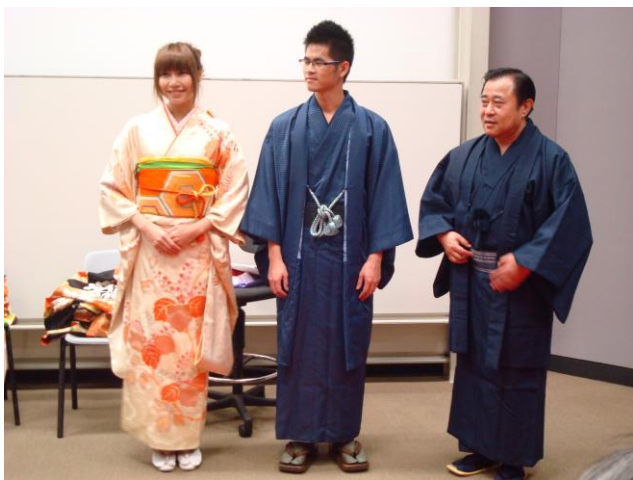
日本文化課的現場和服示範

香港夏天的天氣悶熱，酷暑程度不輸台灣。夏天天氣和台灣很像，偶爾會有颱風，但炎熱的時間比台灣長，至少要到十月多之後才會漸漸轉涼。和室外的酷熱相反，香港室內的冷氣開得極強，海港城的冷氣尤其寒冷。因此一定要帶一件冷氣房用的薄外套，否則很快就會感冒。我去的那年冬天冷的比較早，十一月就有幾次接近 12 度的低溫，反而比台北還要冷，但十二月就好一些。普遍來說香港冬天的氣溫和高雄差不多，不太會下雨，但鋒面來的時候也是滿冷的，厚外套還是要帶著。棉被的話可以帶四季用的涼被或是比較輕的羽絨被，畢竟夏天熱可以開冷氣，但冬天要是不夠暖會很麻煩。