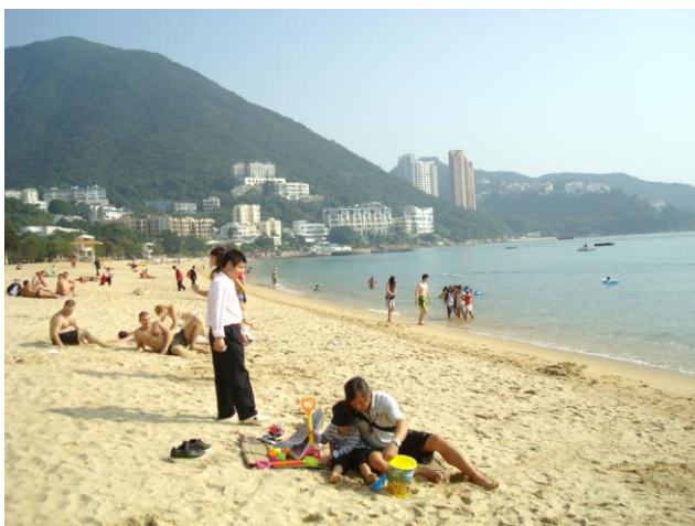
淺水灣是香港少數的沙灘之一