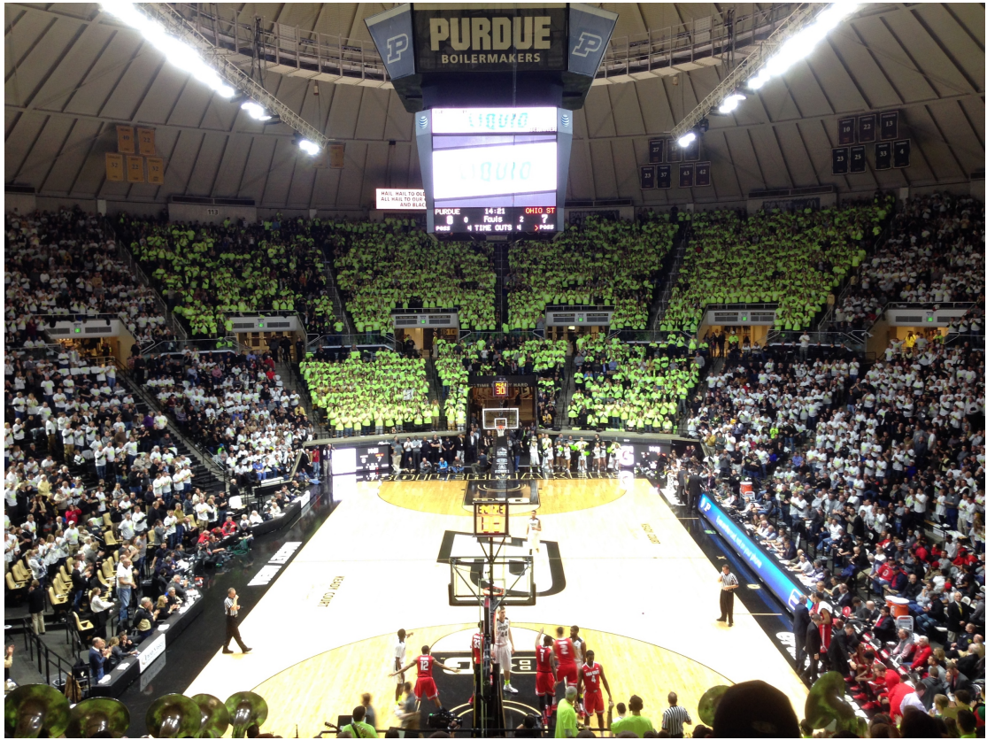
Purdue 籃球隊的主場 Mackey Arena