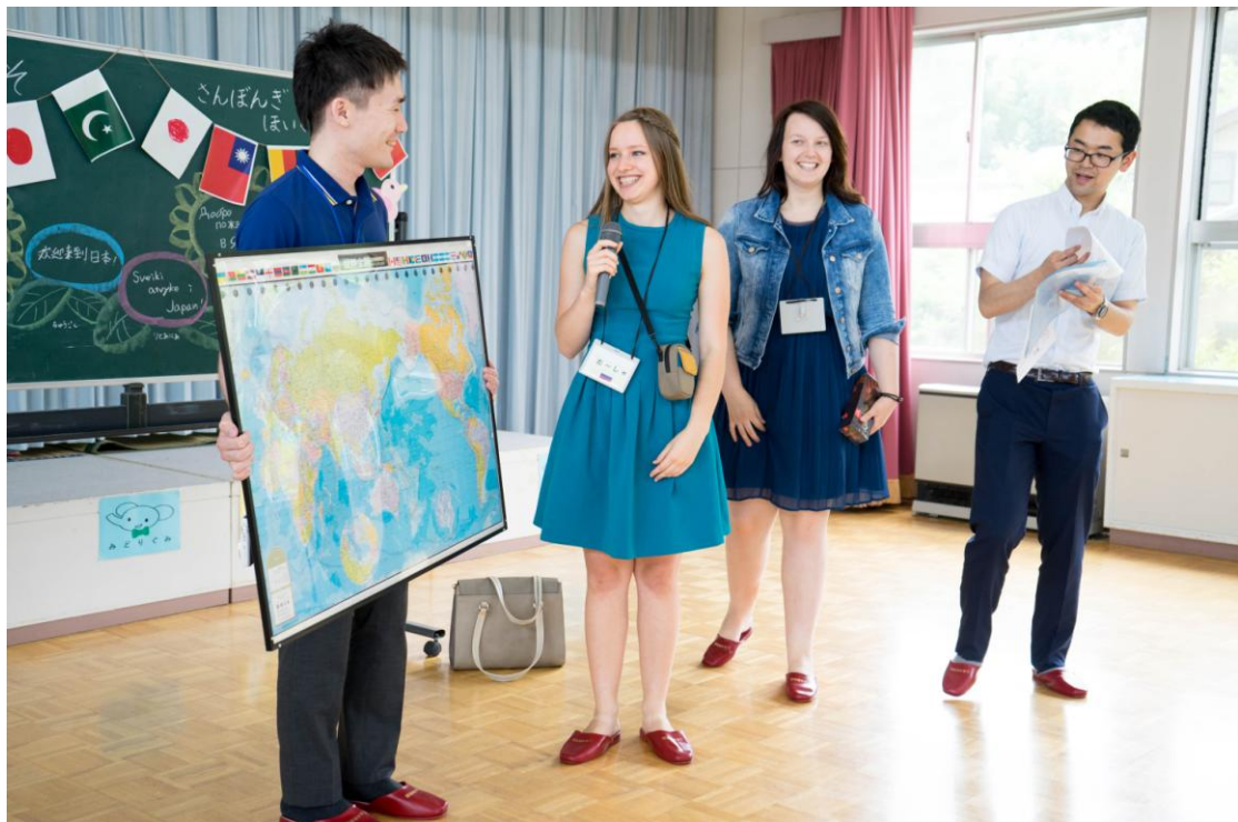
俄國和立陶宛的交換生，在幼稚園用母語介紹自己的國家。