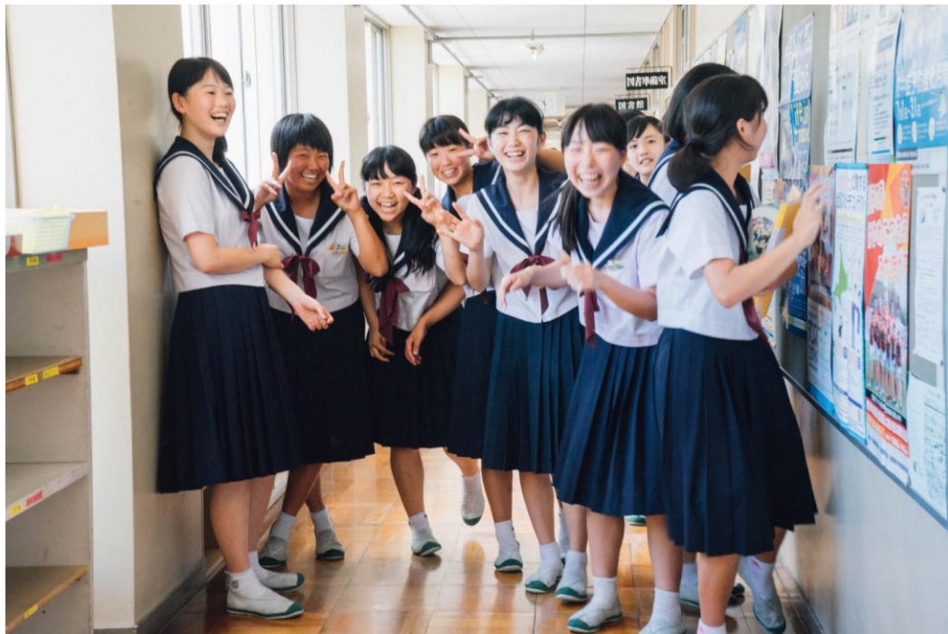
超級可愛又有元氣的日本女學生們！她們都是阿里的粉絲團！