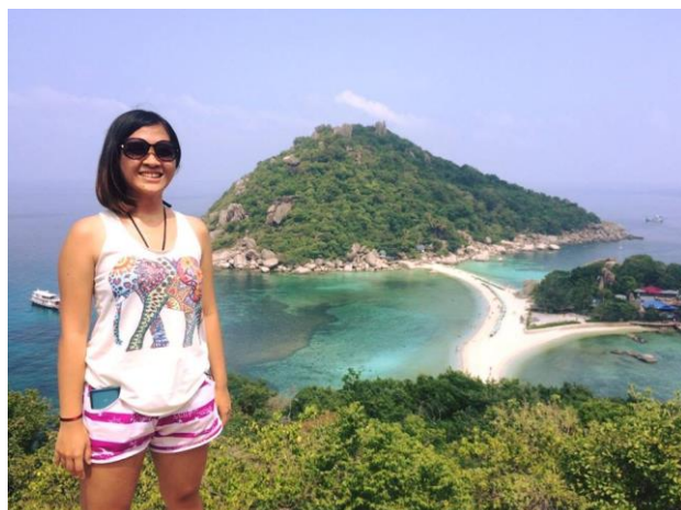
@南緣島 View Point

蘇梅島是距離曼谷，需要搭上 11 個小時的夜車，再加上 1 個多小時的船，才能到達的島，島上的物價偏貴，但蘇梅島給我的感覺就像來到了另一個泰國靠海的城市，不像真的在一座島嶼上。島上應有盡有，甚至還有 Big C，當時我和朋友租了一台機車環島，去島上的各個景點，島上有野生動物園、獨木泛舟，也有很多值得一去的奇形怪狀海岸。其中有一天，我們花了 1,500 買了海島一日 Tour，去了在蘇梅島附近知名的龜島(Koh Tao)跟南緣島(Koh Nayoung)，龜島是著名的浮潛和潛水勝地，但真的要敢游到深的地方，才能看到很壯光的景色，剛好出遊的時候，都跟船家混熟了，船家就會穿戴好浮潛的裝備和蛙腳，帶著我游到深的地方。南緣島則是私人島，每天只開放特定的人數入場，就是為了維持島上的整潔和旅遊品質，來南緣島一定要費個體力爬到最高處，一覽整個南緣島，特別的是在退潮的時候，島與島之間的沙洲會露出來，但在大漲潮時，沙洲會消失。蘇梅島和這兩個島，都是很值得一來的地方，只不過中國觀光客越來越來多，偶爾會失了點品質或掃了點興，不過景還是很推薦大家來的。