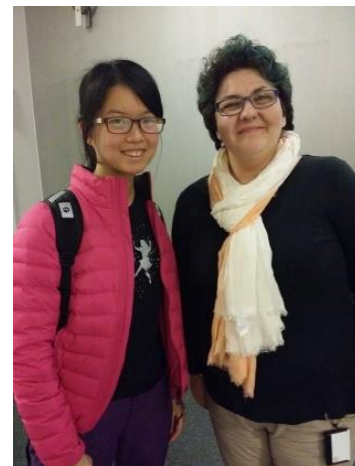
可愛的挪威文老師

書籍在挪威很貴(挪威應該沒有便宜的東西...)，因此要竭盡所能找到花最少錢擁有課本的方