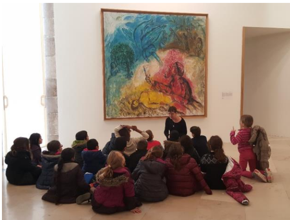
圖為尼斯的夏卡爾美術館。歐洲美術館、博物館多，常看到小學生到美術館或博物館上課、校外教學，很震撼很棒的教材。

另外，到每個景點前，若能先了解景點的故事、當地文化或特色，參觀起來會更有意義，也更印象深刻，強力建議預先做功課。