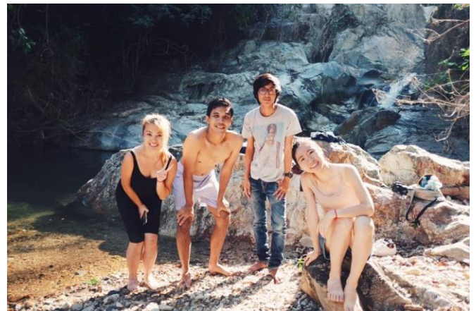
Lan Sang National Park

之後幾乎每兩個周末，我們都會到不同的國家公園，特別介紹離曼谷最近的兩個知名的國家公園，車程約三~四個小時就可以抵達。