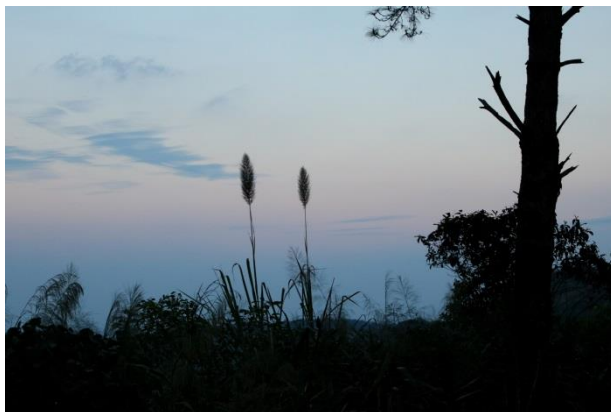
Taksin National Park

我第一個去的國家公園是 Taksin National Park，錯估登山難易度的我和美國室友，走到累得喘不過氣，當晚我們在國家公園內露營，滿天星星加上森林的圍繞，非常清幽！隔天我們馬不停蹄地進入另一個國家公園 – Lan Sang National Park，這個國家公園內共有七座瀑布，我們一路向上爬，爬到最頂點的瀑布後，再原路回返，選擇一個適合的瀑布後，我們在那跳水、游泳、享受日曬，這個國家公園是我在泰國最喜歡的國家公園！