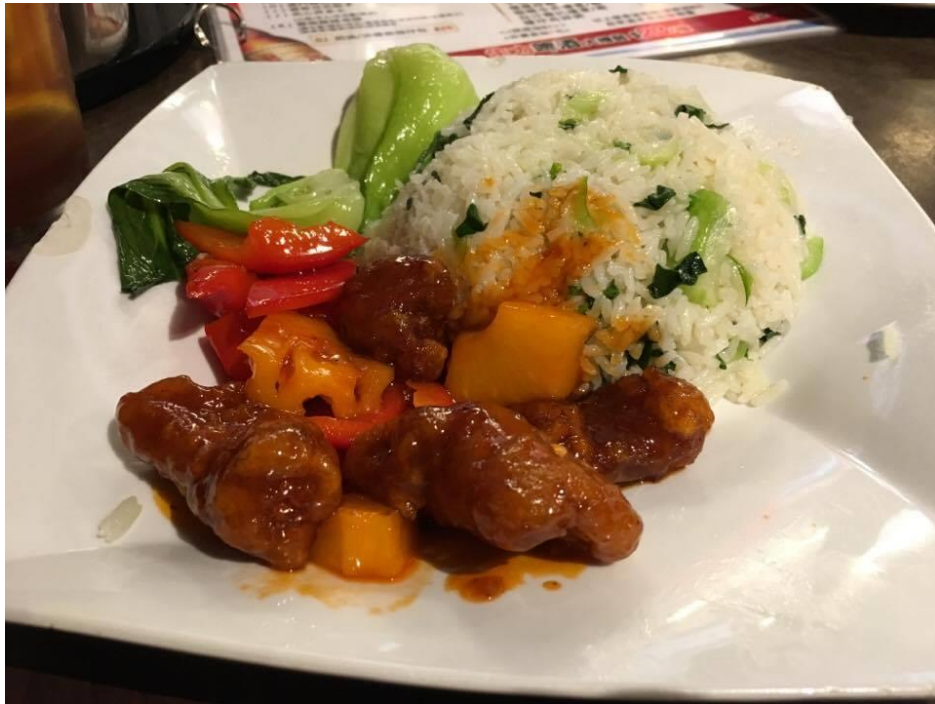
午市套餐-菠蘿咕咾肉菜飯

南山邨是學校附近的小村莊，這邊有菜市場、還有一些小吃，到了晚上更會有許多攤販出來擺攤，像是夜市一樣，越夜越美麗，從學校走過來大概 5-10 分鐘就到了，我們很常到品香樓吃午餐套餐，一份約 38 元港幣(含飲料)，每天會有不一樣的套餐，好吃又很飽，當然旁邊也有許多攤販，像是賣粥或是冰室都很棒！