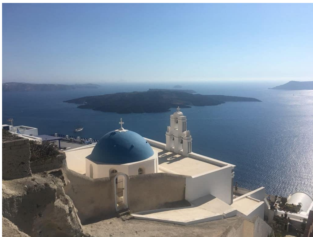
( 大家必看的藍頂教堂！實際上也才6頂左右的藍頂教堂，沒想像中多 )