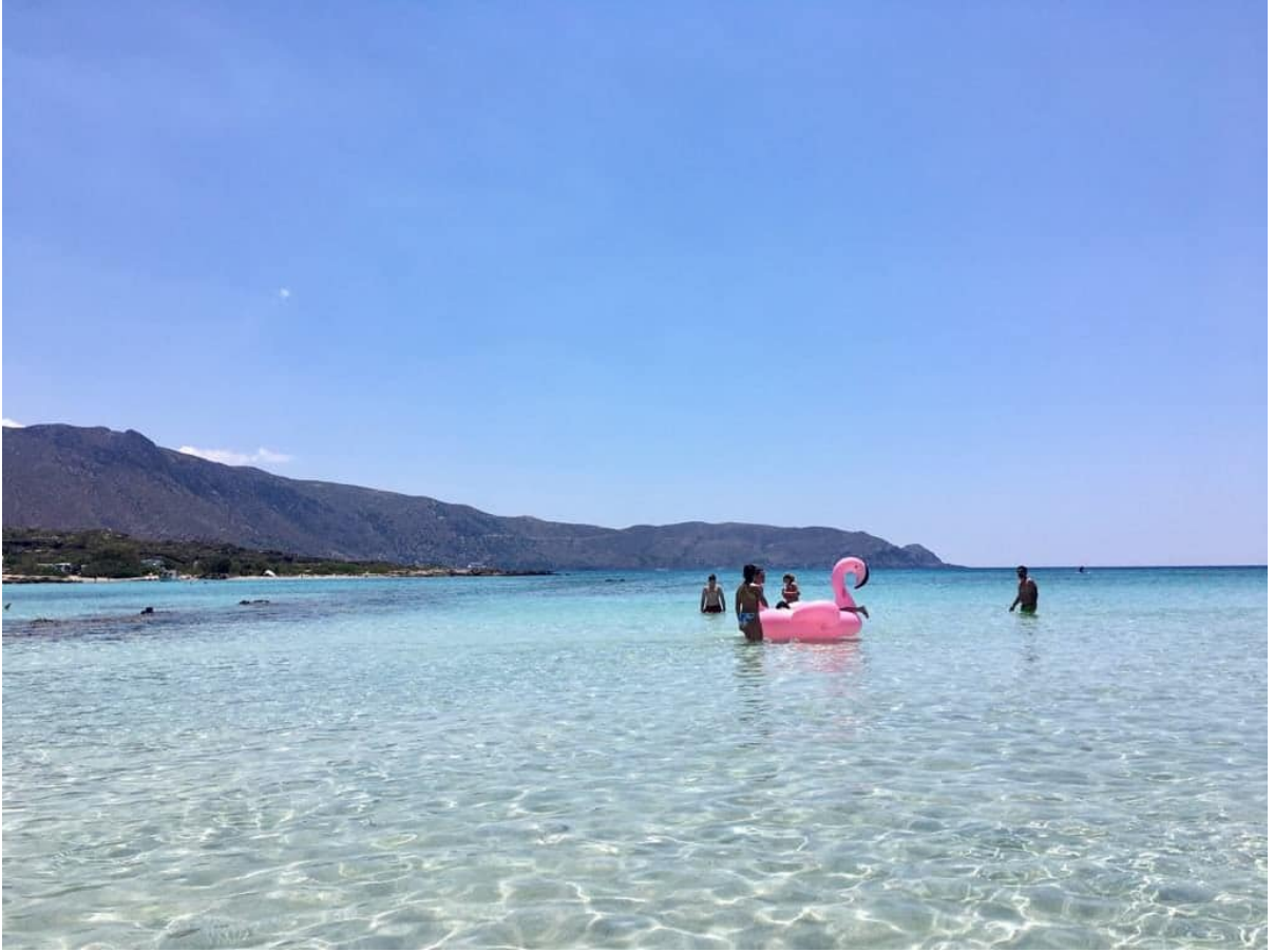
(希臘最大也是最遠的離島-克里特島的elafonissi beach)