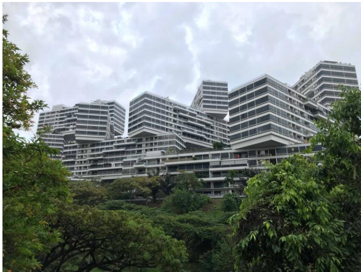
(The Interlace Condo)