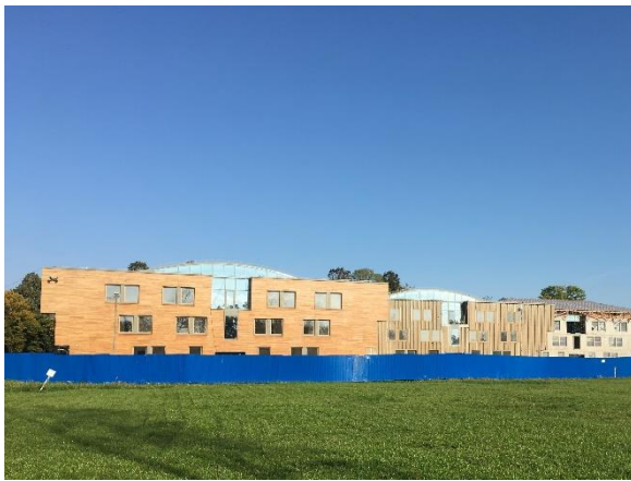
興建中的學生宿舍