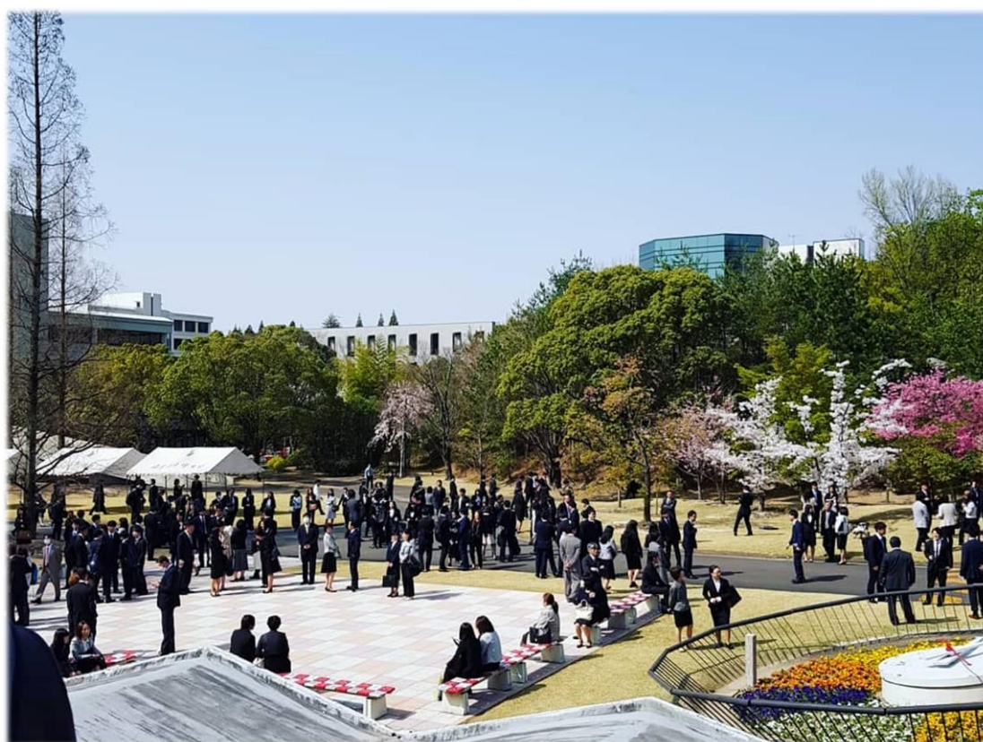
入學式當天的情景

三個目標：1. 學習日商會計知識，考取證照。2. 參與大學社團，增進日文口說能力，結識日本朋友。3. 確定大學院研究方向，撰寫日文研究計畫以及履歷。訂下目標是一件很重要的事情，然而我在政大時經常聽到同學這樣說：「交換不就是去玩嗎？」，先說我自己個人是非常不認同這種看法，倘若來交換只是想來到處玩，花父母的錢和學校的公費到處跑甚至跑遍整個日本，最後回到台灣說：「我拓展了國際觀，我跑了好多地方，視野變廣大了！」，那我建議你還是不要拿短期留學簽來日本，直接休學用旅遊簽來自助旅行不就好了，甚至還不用繳學費。