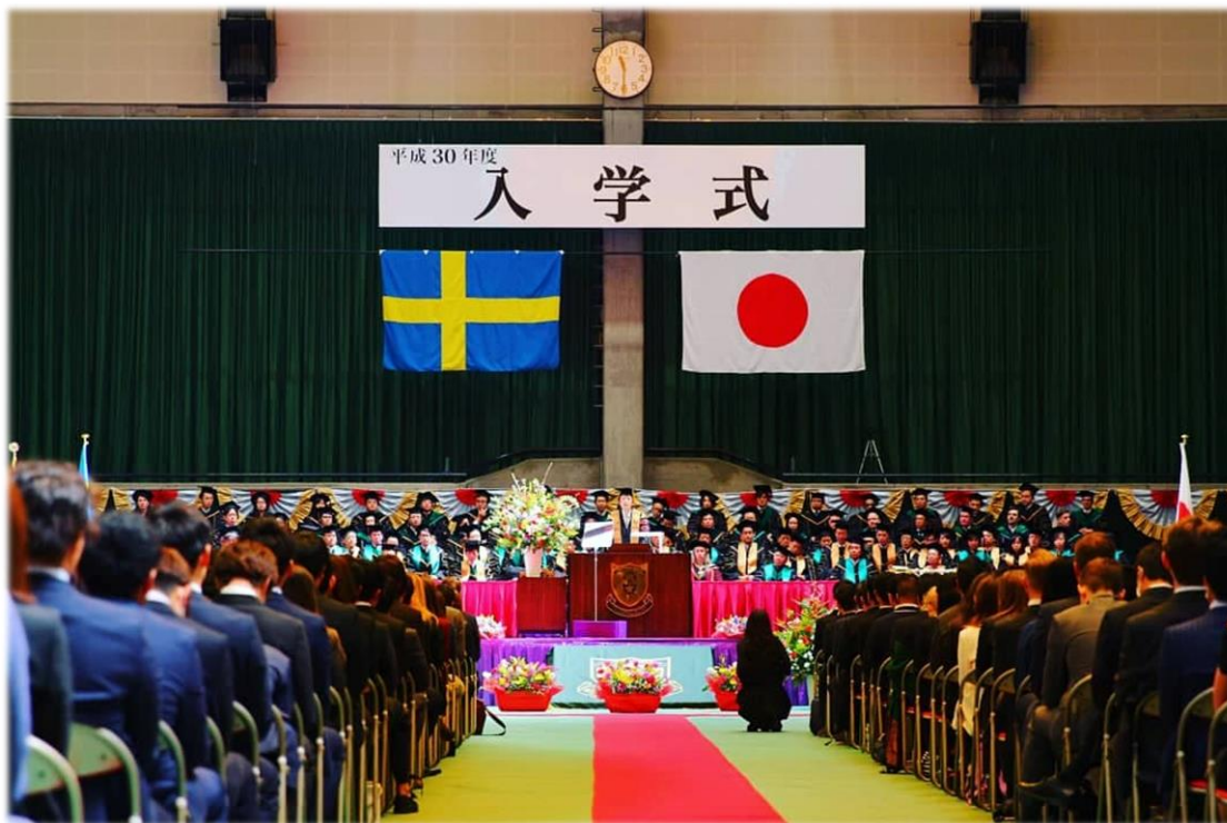
名古屋商科大學入學式

開始看這篇文章，想必都是對日本感興趣或準備前來交換的同學吧！由於我也很喜歡看電子報的人，因此我的內容會盡可能與之前的同學不重疊，讓大家認識不一樣的日本交換生活！