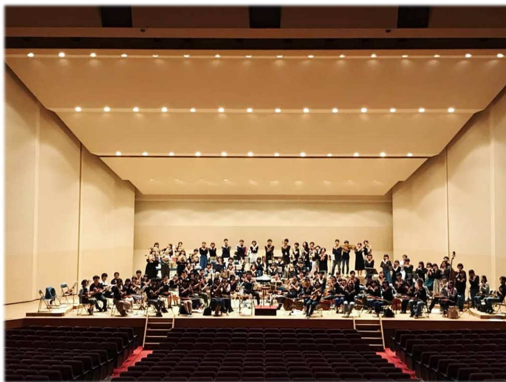
第 114 回名古屋大學交響樂團定期演奏會

來日本最慶幸的事情就是有來參加名大交響，不僅音樂造詣和日文能力大幅提升，最重要的是認識了我在日本最要好的一群日本朋友和前輩們。