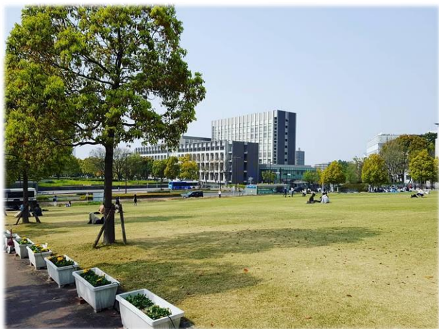
出地鐵站可以看見一大片草坪