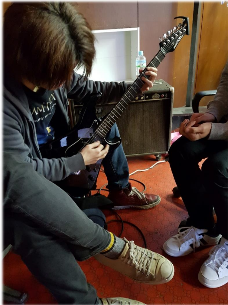
非常熱情的日本朋友邀請我去社辦彈吉他聊樂團

如果是日文有一定程度的同學可以去 Twitter 或 Instagram 搜尋名商大該社團的名稱，可以看到該社團的新歡活動或聯絡窗口等訊息，就不用再透過學校聯絡人這個窗口多一步程序去加入。像我自己就是透過 Twitter 找到名商大的輕音部，去了他們的迎新 Live，認識了一個非常熱情的日本朋友，原本非常想跟他一起組團出表演，無奈在日本沒有電吉他，加上後來另一個社團極度忙碌的關係只好作罷。