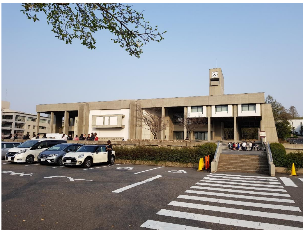
象徵名大地標的豐田講堂

名大還有非常便宜的學生食堂，沒有記錯的話整間大學有四個地方有，自己覺得以這個價位來說非常划算又好吃，例如咖哩飯只要 250 日幣左右就吃的到！非名大生也可以進去吃。