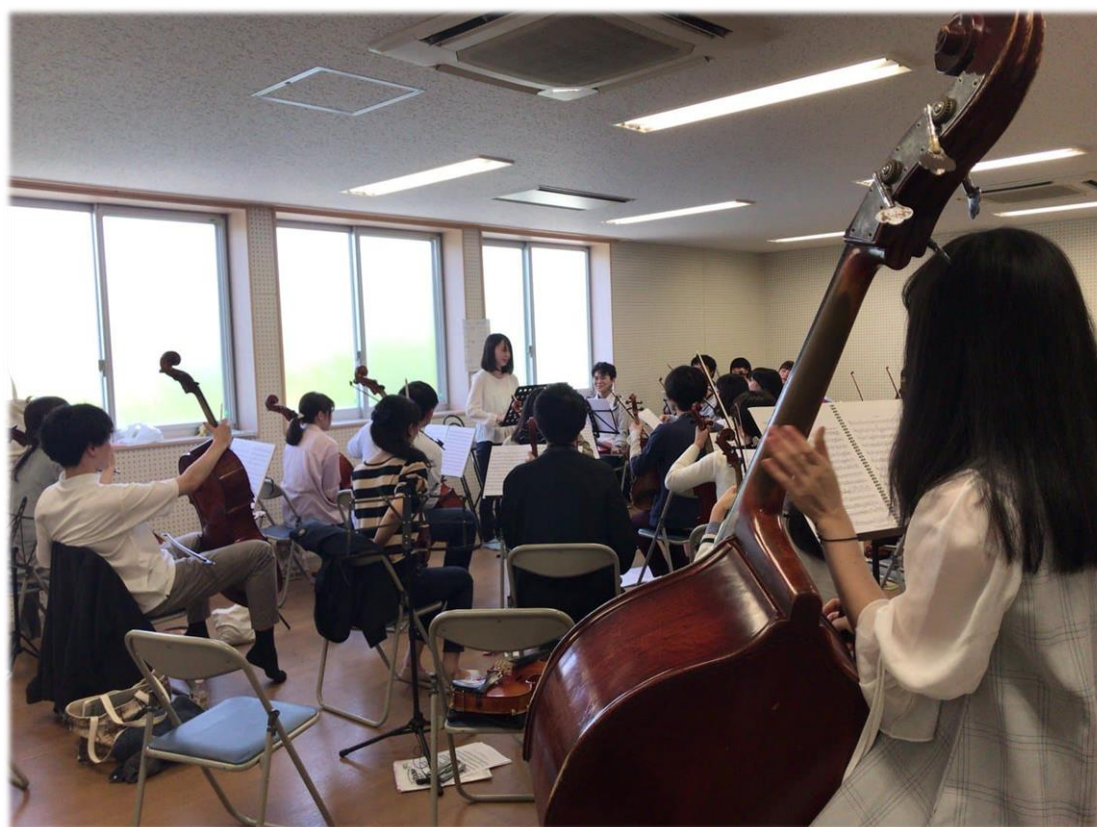
名大交響週末弦分奏

大多數都不是第一次接觸留學生，甚至曾經出國留學過的同學也不在少數。但是，跟平常有在接觸留學生和完全沒接觸過留學生的日本同學相處完全是兩碼子事！這是在我參加名大交響一個多月後得出的心得，在這邊可以更深入的體驗日本極度重視禮儀的文化。首先由於我是剛進樂團的新生，就算遇到年紀比我小的二年級生，也要記得用敬語對話，這是基本（雖然有些人會跟我說因為我是外國人沒關係，但我相信一定多少會有影響，至少要盡可能避免對前輩用常體），這也讓我強烈感受到與前輩和與同級生相處的氛圍非常不同（但我認為這是好的氛圍，前輩非常照顧學弟妹，而學弟妹也很尊重前輩），也因此我跟一年級生的感情都比較好。再來是看到人主動打招呼說「お疲れ様！（辛苦了！）」，團練結束對彼此說「ありがとうございました！（謝謝！）」或「お疲れ様でした！（辛苦了！）」也是基本。