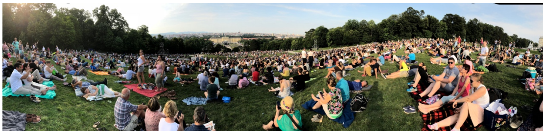
維也納愛樂夏季音樂會的盛況 (這群人還只是冰山一角！)

聆賞攻略：請提前約『3~4個小時抵達活動現場』。千萬不要以為熊布朗宮的後花園很大，就對維也納愛樂的吸睛層度掉以輕心。如果晚到，你就可能面臨以下照片的這種驚人情況，連在草地上想找個地方坐下都有點困難！