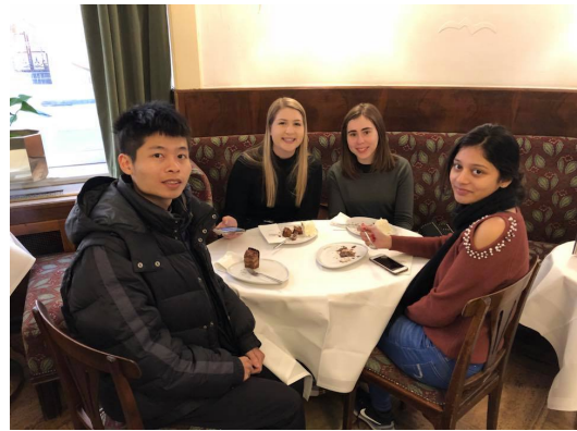
咖啡館與組員的合影