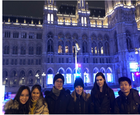
與同學們的滑冰合影