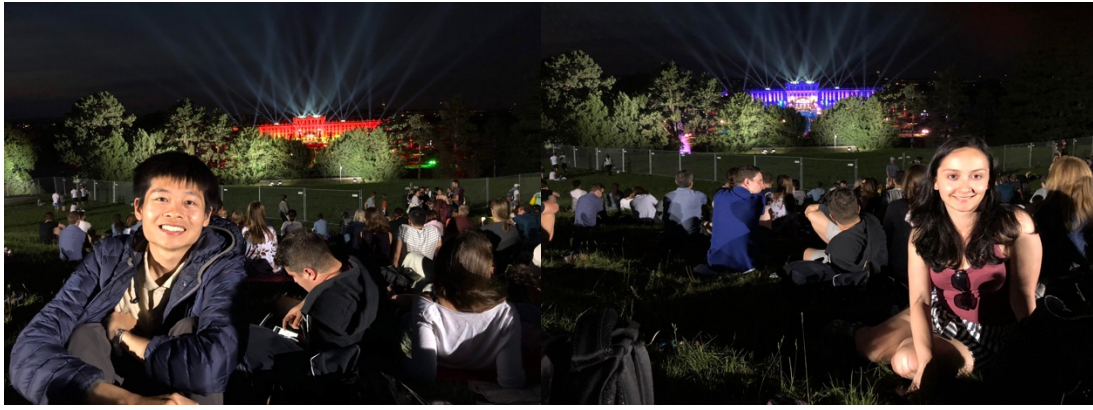
從山上望下去的景象

# 攻略二：如果想聽音樂的同學，建議不要坐在凱旋門附近最高點的位置，因為距離實在太遙遠，聽其他同學說會太小聲根本聽不到；如果想要卡在站位第一排，請『提前四小時』至現場卡位。不過即使是站位第一排，離舞台還是一小段距離，見下圖。