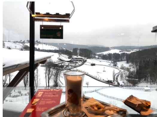
從巧克力工廠看出去的景象