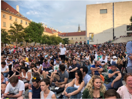
露天音樂會的盛況