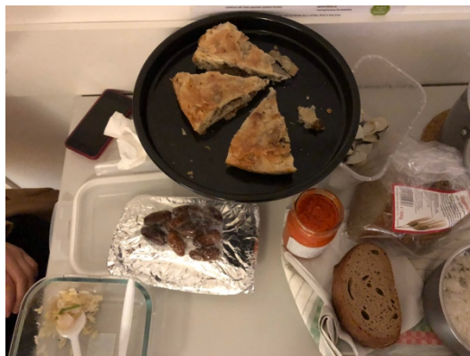
土耳其特色小吃與馬其頓醬