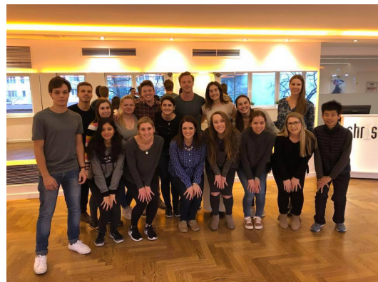
華爾滋課程的合影

我個人覺得這個 cultural program 最有趣的地方，就是去 Graz 參觀巧克力工廠了！這個工廠位在 Graz 鄰近的郊山，如果自己旅行的話大概很難到得了。在那裡可以盡情地試吃各種神秘口味的巧克力，而且是吃到飽的形式。我去的時候運氣正好，碰到奧地利下大雪，從巧克力工廠向外看，可以看到一大