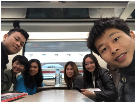
一起乘坐高鐵的合影

這趟旅行我非常幸運：夥同泰國、印尼還有香港的朋友們，組了一個7人的團隊一起旅遊，而這些同學多數也是我在 cultural program 認識的。之所以要組這麼多人一起旅行，原因就在於我們認為到義大利旅行有些危險：在路上或地鐵站中，隨處可見吉普賽人伺機行竊或搶劫的身影，也有很多軍人荷槍實彈地來回巡邏。