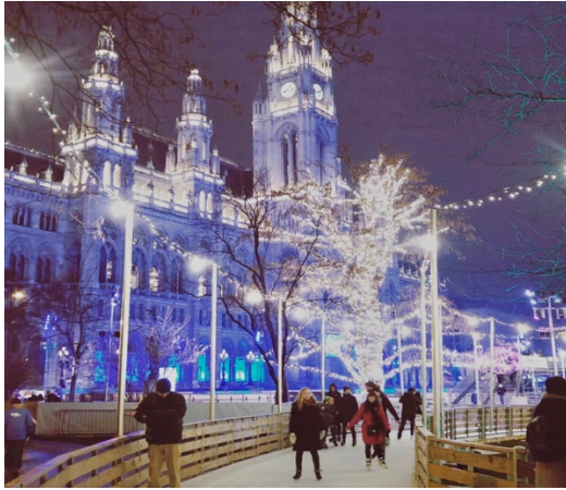
市政廳前的滑冰夜景