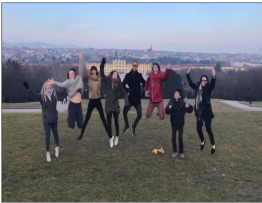
熊布朗宮的跳躍合影

在學期開始前，我有參加學校安排的 Cultural program 活動，該活動有待我們進行維也納城市導覽、去美景宮、熊布朗宮、奧地利國家圖書館、Albertina 美術館、城堡劇院、咖啡館，甚至還有安排我們去參與華爾滋舞蹈課程、去 Linz 與 Graz 兩大城市。