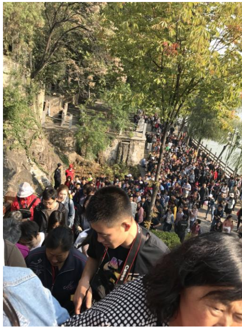
(圖為連假時期的洛陽龍門石窟，非常多人，氧氣濃度非常低)