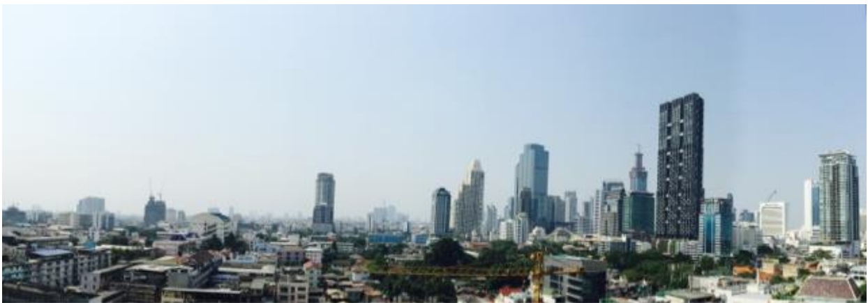
↑ 從窗外看出的景色，非常遼闊！