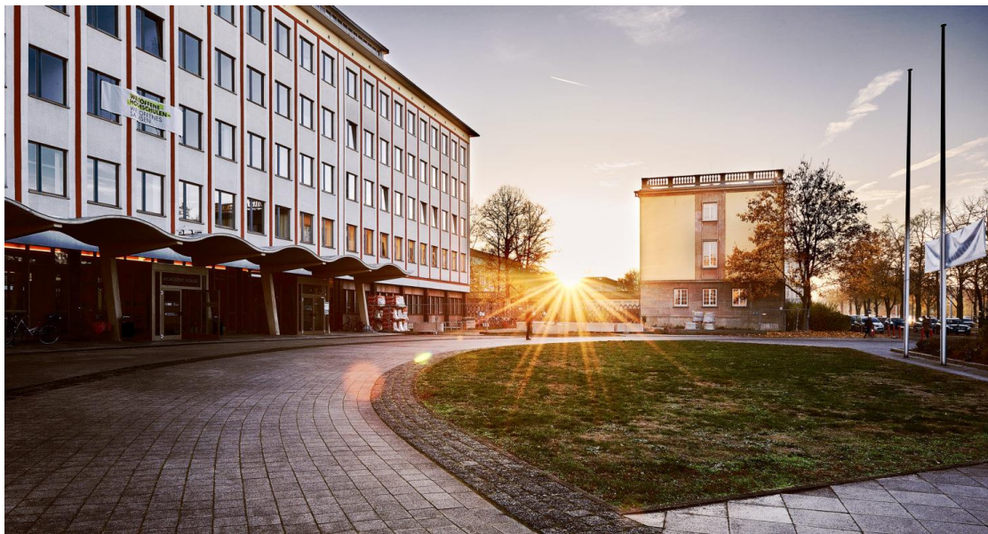
Leipzig HHL 夕陽

很感謝有這次交換的機會，除了達到我原先預定的目標：“希望看看西方的高等教育”以外，因為也跟同學一起投入做作業，學得到很多。