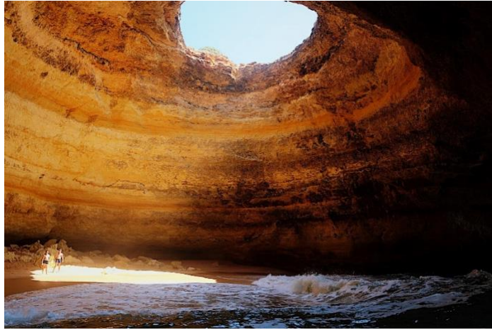
貝納吉爾洞 Benagil cave