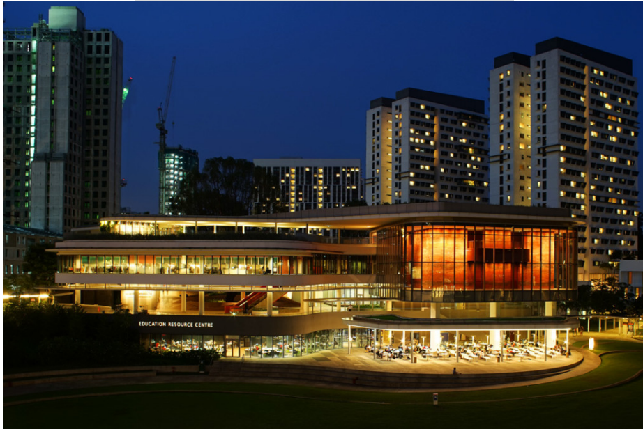
(Utown 裡的 Education Resource Center)

平常最喜歡下午的時候坐在 Education Resource Center 一樓的開放式空間看外面草坪讀書，旁邊還有開 24 小時的 Starbucks。(Starbucks 旁邊的熱壓三明治販賣機不要買，很難吃)