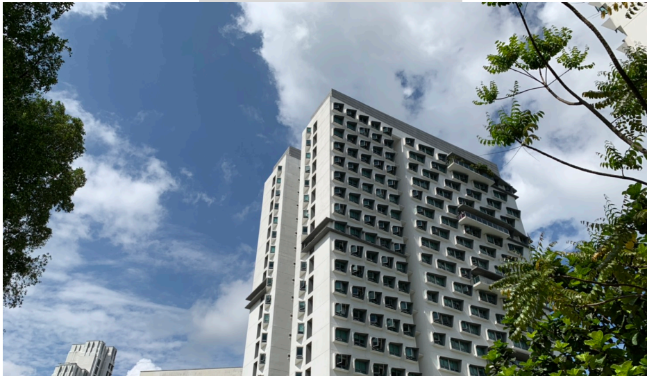
(Cinnamon College 外觀)

好像比較少看到有人分享 Cinnamon College(USP)宿舍，住在這邊的大部分是 Local 的學生 (Utown Residence 絕大部分是交換學生)，而且據說很多都是學霸等級的，因為是參加 USP (University Scholarship Program) 的學生可以優先入住的樣子。College 宿舍的裝潢比較比不上 Utown Residence，但是平時會舉辦比較多活動，而且還有強制規定要有 Meal Plan (平日供早晚餐)，所以就看大家考慮的點是什麼。PGP 則是離 Utown 非常之遠，很多人到學期中都申請從 PGP 搬到 UTown 來。