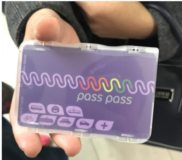
(借用同期學姊的手)