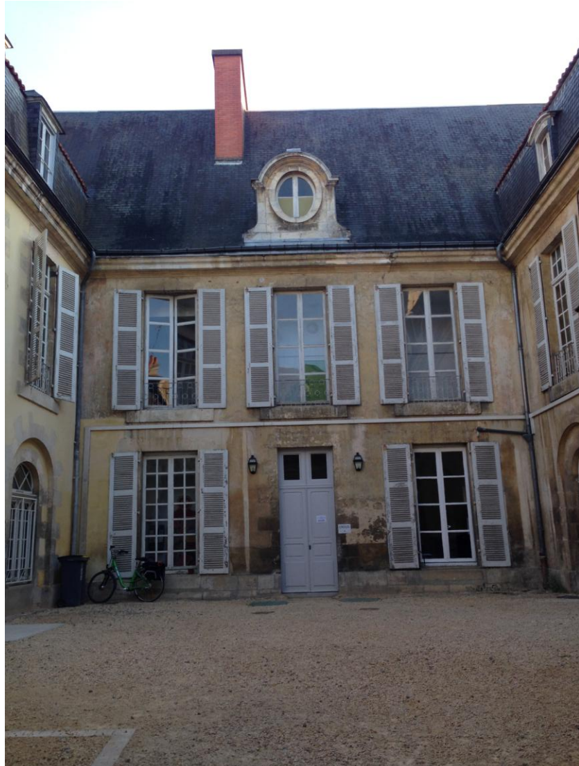
Jeanne d' Arc 外觀