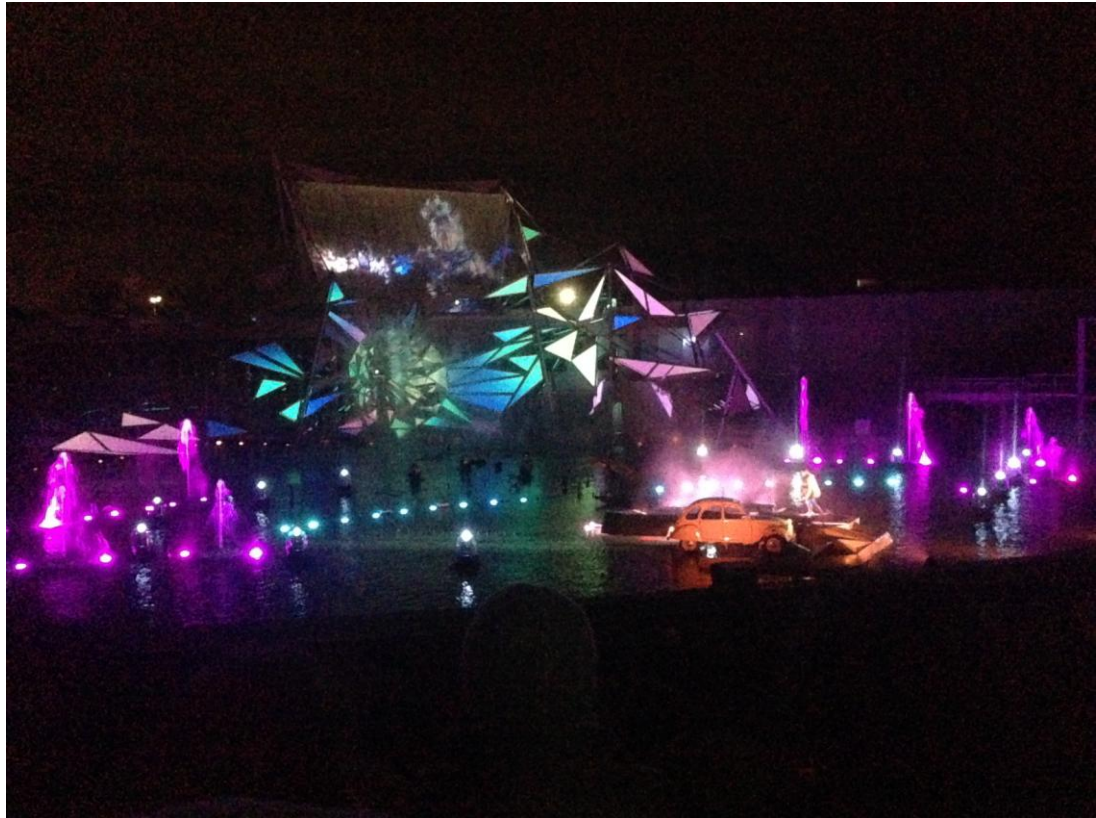
晚上的 3D 燈光水舞秀

普瓦捷距離法國第一的遊樂園未來影視城(Futuroscope)10 公里，裡面的設施驚險刺激，並且可以探索發現那些運用最新影像技術製作的精彩遊樂專案：動感電影、3D 電影、巨幕電影等等，晚上還有非常精采的 3D 水舞燈光劇表演，如果湊到很多人一起去就可以先在網路上買團體票，比起原價便宜滿多的。