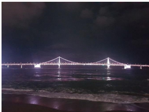
釜山地標，位於廣安里海水浴場的廣安里大橋。