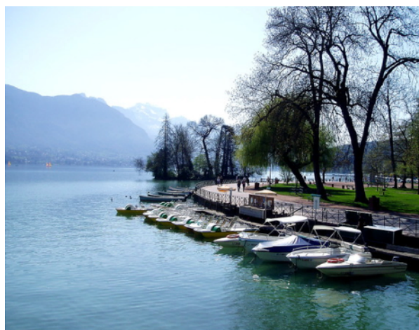
(左)安錫島宮 (右)安錫湖