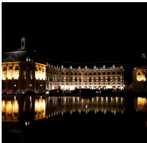
(左)比拉沙丘 (右)波爾多水鏡廣場