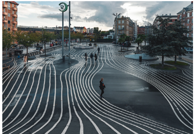
(左)Louisiana museum of modern art (右)Superkilen Park