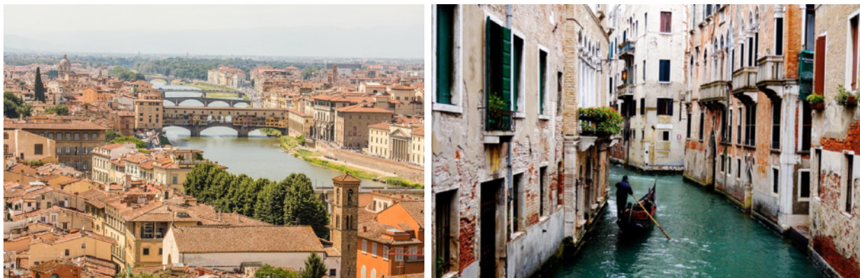
(左)佛羅倫斯米開朗基羅廣場觀景 (右)威尼斯水巷