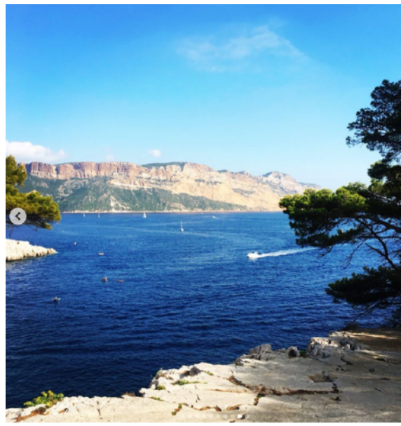
(左)聖十字湖 (右)卡朗格峽灣