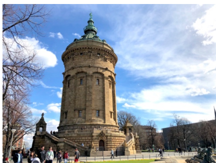
曼海姆的地標 Wasserturm(水塔)

這真的很看你所分配到的新創公司對此專案的規劃，重要的是要表達自己的意見和想法。在整個過程我都非常明確說明我對課程的期待，與希望接觸的事情，但沒有很好的回應。所以我建議在第一堂課要跟新創公司深聊他們對專案的想法，若覺得不符合自己的期待就盡快退選，因為當專案開始後就不能退選了。