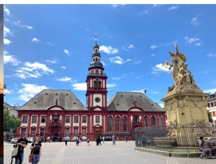
曼海姆市中心 Marktplatz(市集廣場)