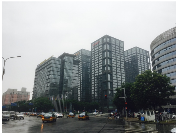
圖四：清華科技園區

清華是全中國大部分教育資源聚集的地方，在這裡的一學期深刻地體會到清華資源豐富的程度，不論是單純教育上的資金、設備、師資的挹注，每個月都會有某某國際企業的老闆來演講等，如紅衫資本中國合伙人、郭台銘等，此外，學生創業時所需的輔導資源也是一併俱全，清華由於主力還是以工科為主的學校，因此許多學生的研究或是技術專利只要夠好，都能藉由清華校方主導的孵化器獲取各方資源，其中包含以教授為主的顧問團隊、創投資金、創業空間、各類創業競賽等，一步一步協助學生新創公司茁壯。因此我個人非常推薦學弟妹們如果有機會到清華交換，一定要好好利用當地的資源。