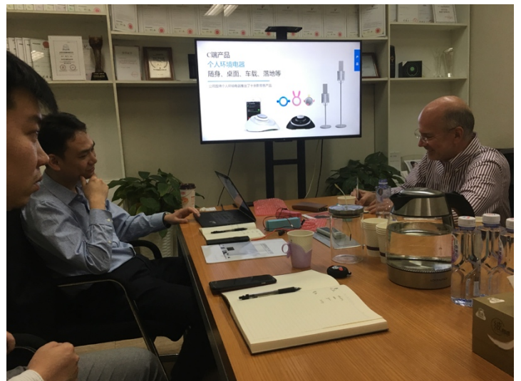
圖二：與教授、新創 CEO 開會

整體而言，個人覺得清華的資源真的非常豐富，課程內容也非常及時地當配最新的科技發展。