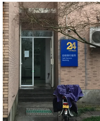
這裡面就有自動櫃員機

中國建設銀行，因為在中國移動旁邊，但是我是大陸朋友匯錢給我，所以我不用顧慮「匯率」與「手續費」的問題，沒做特別比較，建設銀行在浙大的自動櫃員機滿多的。