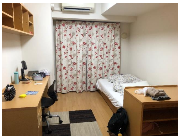
宿舍房間內部一小部分照片，如想看整個房間的影片可以私訊我！

文化交流方面主要由 CIA 和 CESA 舉辦。CIA 會舉辦各種活動像是抹茶體驗之旅、爬山、homestay 等等的，學期一開始就會列出他們會舉辦的活動和名額限制，基本上很多活動都很搶，尤其是出遊的，想要參加的話要馬上報名，不然很快就會沒了。這些活動中最推薦的是 homestay 和抹茶體驗，這些活動會在電