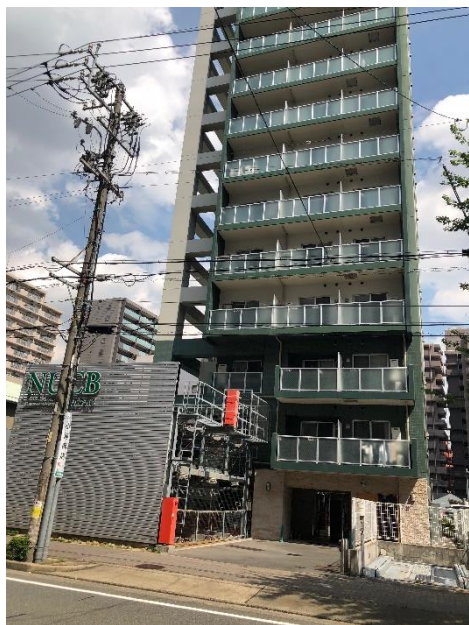
← 千代田寮外部照片像公寓式總共有 15 樓

千代田寮是像公寓式，一人一間房，沒有公共空間，但是房間設備齊全，有小廚房、洗衣機，什麼都有，非常舒適。千代田寮的缺點就是離學校很遠，來回至少要花兩小時，要先搭地鐵到赤池，再轉公車，可以先查好搭哪班地鐵接公車比較合適，就可以省下很多等待的時間。看起來交通費非常貴，但是如果有辦定期票的話就蠻划算的，也別忘了去 CIA 買公車票會省下很多錢！千代田寮因為生活機能好，房租每個月要 8 萬日圓，但是學校有提供住宿獎學金，這學期分為 3 萬、1 萬 5 和 5 千，大概有一半的人都拿得到。獎學金據說是依據學校要你交的動機去做分配的，建議好好寫動機。除了千代田寮還有 Share House。Share House 位於東山公園站，距離地鐵站 20 分鐘的路程，需要爬坡，並不是那麼方便。加上去學校需要轉一次地鐵，第二段算是輕軌，費用很高，還要再轉公車。Share House 的房租大概是每個月 6 萬，但是沒有獎學金。Share House 最大的優點就是有很大的廚房和客廳，但這也是一個缺點，如果遇到生活習慣不好的室友或相處起來不合適的室友會很痛苦，像我朋友後來就和其中一位室友鬧翻，但是有好有壞，她跟另一個室友感情非常好。如果你是課很多要常常去學校的人，建議可以考慮學校附近的三本木寮。三本木寮由於位在學校附近，非常偏僻，最晚的公車大概是 9 點，所以如果你是很喜歡去市區玩的人，三本木寮可能不太適合你。但是如果認想認識當地學生的話，三本木寮會比千代田寮好，而且三本木寮有交誼廳，據說大家常常會聚在一起煮東西。房租是三個宿舍中最便宜的。CIA 會在 8 月時寄信詢問自願序，三個宿舍各有好壞，建議依照自己的需求去決定。