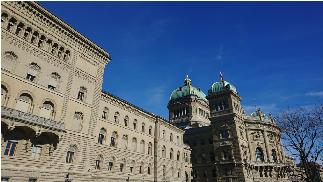
聯邦宮 a.k.a. 瑞士國會 · 可入內參觀但要預約