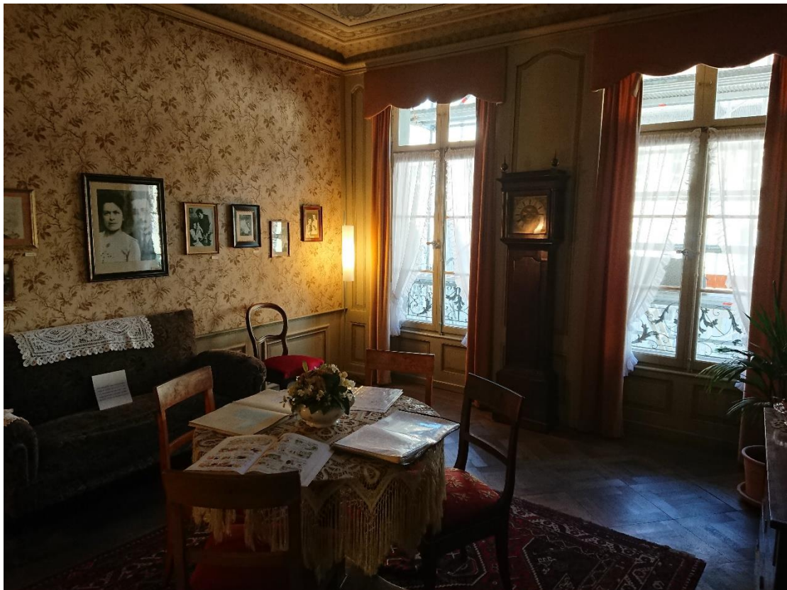
愛因斯坦在伯恩的故居