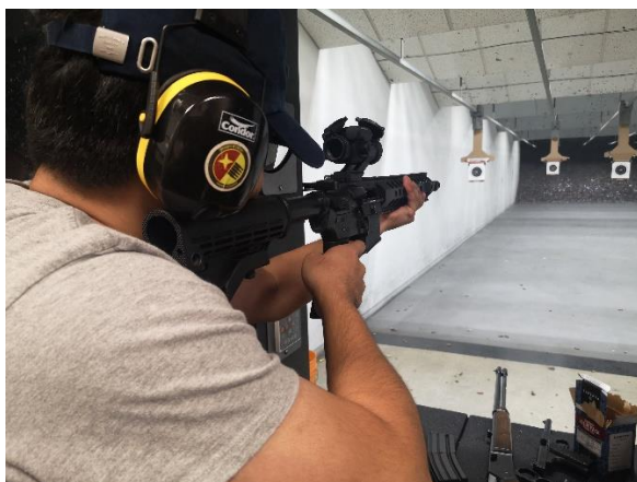
配備全息瞄準、消焰器的民用版 AR-15