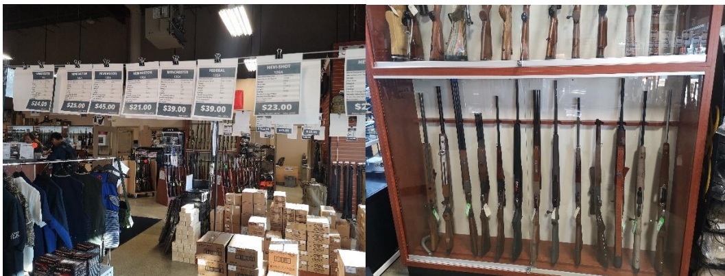
Calgary Shooting Center 槍店一角

我在 Calgary 的不同地方體驗過射擊，總的來說大同小異，如果你常去射擊，可以選擇跟進學校社團的活動，價格比自己去靶場便宜一半以上（每次參加射擊打到雙手舉不起來花費不到 50CAD）；而且 Firearms Association 還會協助把你載到靶場。Calgary 的靶場跟槍店基本都在城市的南邊（Chinook 附近）還有一家在 Marlborough，從學校搭乘 C-Train 到 Chinook 需要一個小時。