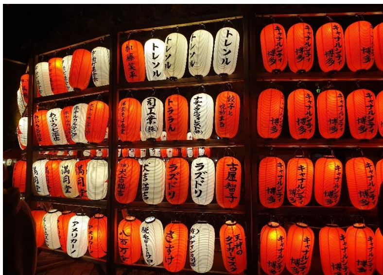
千年夜市裡掛滿紅色的燈籠

福岡最著名的街頭景色，即是「屋台（やたい）」，類似台灣的街頭小吃，會賣拉麵、煎餃、串燒、關東煮等。由於日本法律並不允許在街頭設立攤販，所以屋台算是福岡政府特別允許保留下來的庶民文化之一，到了夏天，靠近中洲一帶的河邊，會聚集許多販售不同小吃的屋台，街邊還會掛上紅紅的燈籠，像是夏季慶典般熱鬧，學弟妹可以在夏日夜晚來這裡體驗傳統熱鬧的博多文化喔。