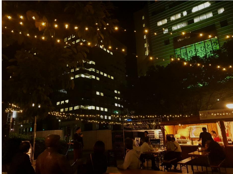
福岡ポルドーワイン祭り

福岡市與法國盛產紅酒的波爾多市為姊妹市，因此每年在福岡市都會舉辦福岡波爾多紅酒祭，讓大家可以秋天的夜晚享受不同風味的波爾多紅酒，雖然規模不大，僅限於市役所前的廣場地區，但現場有音樂演奏、販賣熱食的小販與紅酒吧台，仍可以看到當地居民坐在廣場中一邊品嚐紅酒一邊與朋友家人享受美好的夜晚。