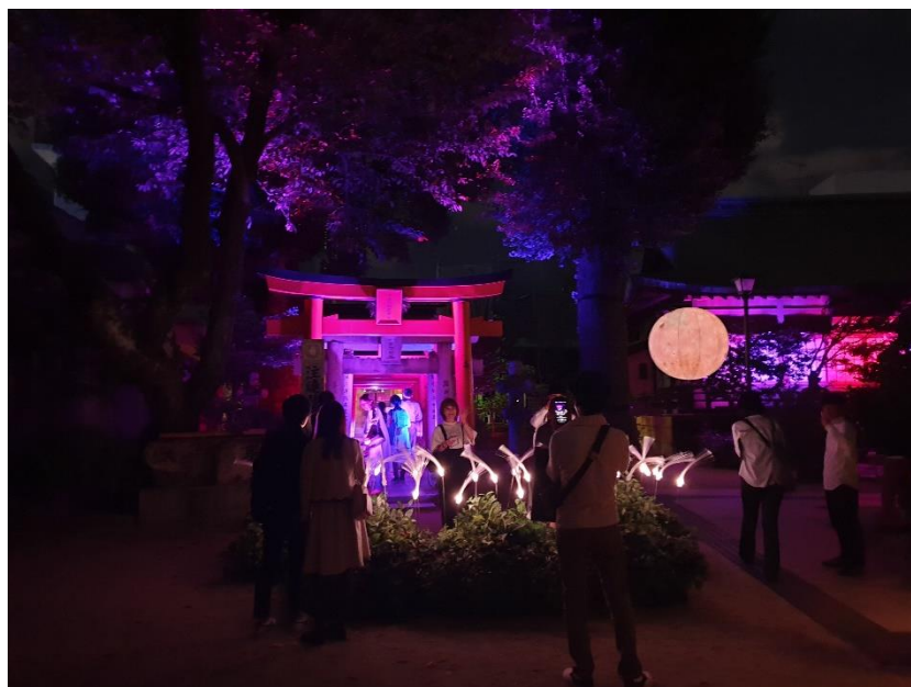
千年煌夜の櫛田神社

現在的福岡市是由以舊的福岡城為中心的福岡區與鄰近港口、對外貿易發達的博多區所組成。博多自中世紀以來作為九州貿易樞紐，商業繁盛，也保留了許多歷史悠久的神社、傳統工藝技術以及充滿懷舊風情的商店街。每年十月，福岡市政府都會舉辦博多舊市街的夜間祭典，聚集於舊市街的眾多神社會在夜晚點上燦爛的燈火，特別是福岡最著名的櫛田神社，到了晚上在燈光與音樂的搭配下，多了靜謐與神祕感。大家可以用散步的方式漫遊舊市街，走累了可以到商店街享受美味的餐點，或是到鄰近的中洲河畔的屋台享受熱呼呼的街頭小吃！