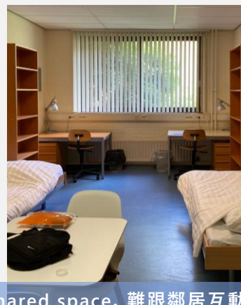
個人比較在意廚房整潔、所以選P,缺點是缺乏shared space、難跟鄰居互動