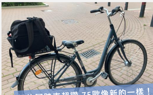
偶的腳踏車超讚 75歐像新的一樣！

其他心得報告應該都有提到、荷蘭對於腳踏車的法規蠻嚴格的，車燈、車鈴這些都可以納入找車的條件裡；另外即便有鎖車還是有可能被偷，所以盡量鎖在安全的地方ex.Guesthouse車棚、學校大樓裡...。腳踏車壞掉的話，UM很貼心偶爾會有 免費修車服務 ，大家可以關注學校臉書。By the way, 荷蘭腳踏車的地位大概跟台灣摩托車一樣，有專用車道而且速度很快，騎車要轉彎的時候記得舉手，行人也要注意腳踏車(非汽車^_^)