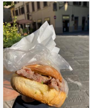
在丹麥碰到很熱情的導遊跟旅客、義大利跟著導遊吃到好吃的牛肚包

另外還有一個省錢魔法就是「居留證」！幾乎可以打遍8成以上的歐洲旅遊景點，只要你拿著居留證、且在26歲以下很多博物館都有學生票、甚至免錢。所以好好把握機會，在這段時間用最低成本的方式走遍各國。