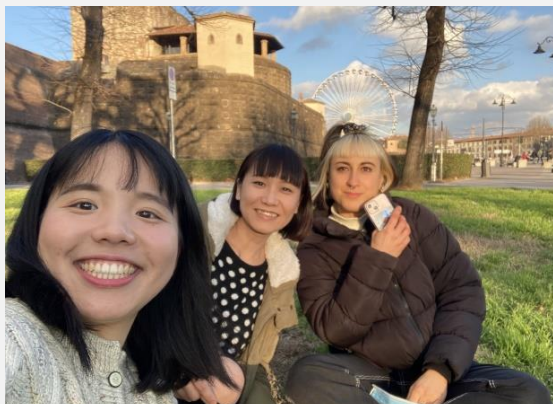
在青旅跟新認識的室友快樂聊天、隔天還一起去展覽、散步