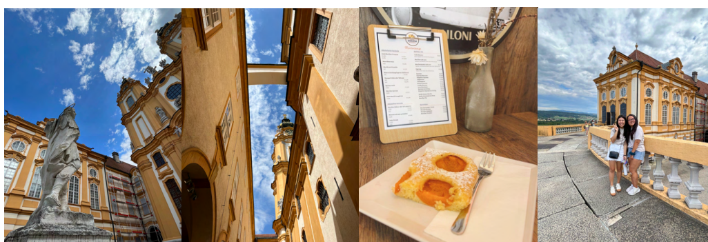
↑ 整個修道院都是以這個黃色為基礎色調 ↑ apricot cake ↑ 當天帶我玩的加拿大朋友

Melk 有著號稱世界上最美的修道院，Krems 則是盛產 apricot。朋友說大部分的遊客會選擇上午參觀修道院，接著搭遊船遊多瑙河最美的一段：瓦豪河谷，一路搭到 Krems 後再從 Krems 搭火車回維也納。不過當時我沒有搭遊船而是直接搭火車至Krems，但去過遊船的朋友們都說不錯，有機會的話大家也可以體驗看看！