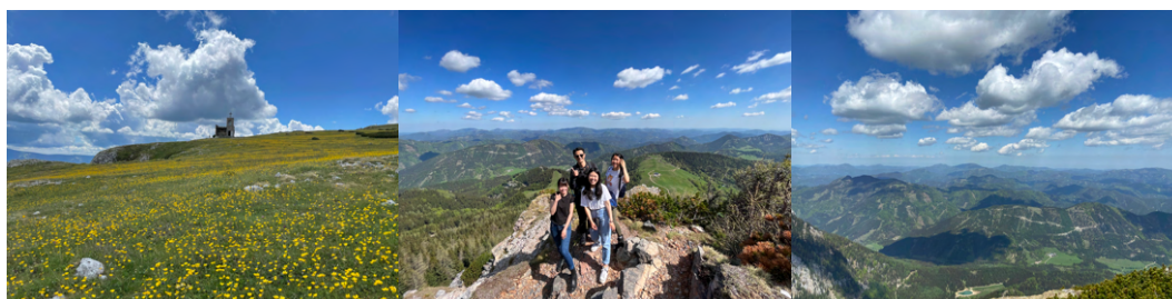
↑ Rex 的山頂有一整片花海 ↑ Schneeberg 則是以遼闊的山景為主

我是搭朋友的車前往這兩座山的，不確定大眾交通工具要怎麼搭，不過如果有機會，推薦大家來爬！景色很美，登山路線的難度對新手來說也算剛剛好，不會太困難卻又保有挑戰性，但要記得穿適合爬山的鞋子，有登山杖最好。爬上山頂後的野餐真的是一大享受！