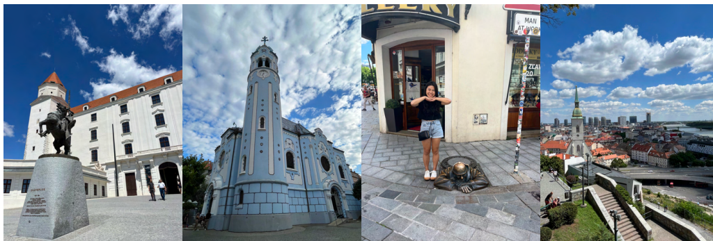
↑ Bratislava城堡 ↑ 夢幻的藍色教堂 ↑ 著名雕像man at work ↑ Bratislava市景

斯洛伐克的首都 Bratislava 離維也納只有一個小時火車程的距離，城市小小的很快就逛完了，很適合安排一日遊。原本想像中的 Bratislava 是一個憂鬱的灰色城市，但實際走訪後覺得這裡其實是一個很活潑的地方，而且物價超級可愛，是個可以吃飽飽再回家的所在！