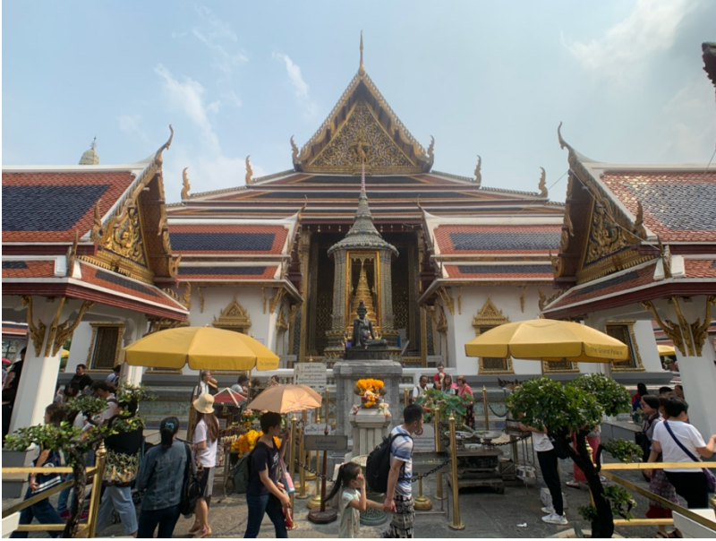
上圖左邊為臥佛寺，右邊為大皇宮。 中間為玉佛寺。 左下為大皇宮，右下為鄭王廟。