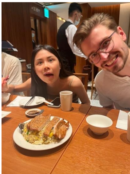
9/17 · 一起去吃鼎泰豐 ( 新生店 )