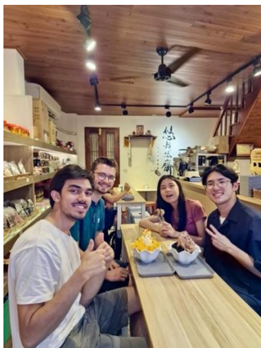
9/8 · 逛完大稻埕去吃芒果冰 · 同行的有台灣的朋友以及從荷蘭來台灣交換的朋友