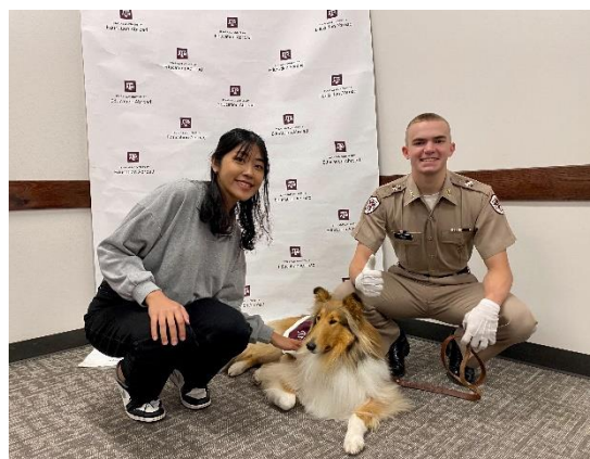
> Reveille 與專門照顧她的軍校學生與開心的我

A&M 在創立初期為軍校，所以學校擁有許多傳統及文化且至今仍保有軍事學院，時不時會在校園中看到他們穿著軍服在跑步。學校的主色為 Maroon 暗紅色，學生們都會稱自己為 Aggie 且稱校園為 Aggieland 而 First Lady of Aggieland 就是學校的吉祥物 Reveille，她是一隻地位崇高的喜樂蒂牧羊犬，有自己的宿舍且搭公車是可以坐在位子上而不是在髒髒地板的那種尊貴待遇。