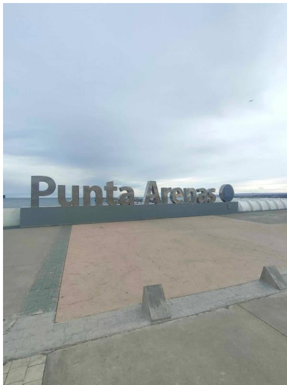
世界最南端的城市~蓬塔阿雷納斯