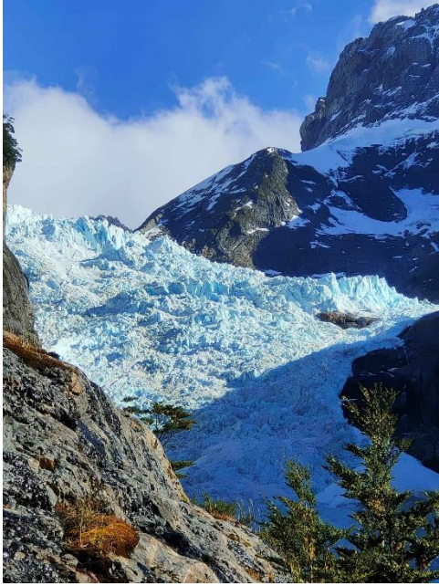
百內國家公園冰川