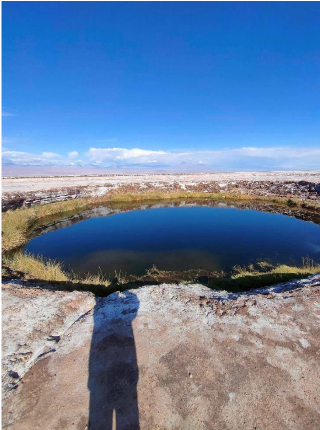
號稱天空跟地連成一線的阿他加馬沙漠

智利我從南玩到北，從沙漠玩到冰川，是一個非常漂亮的國家。記得如果要去南部看企鵝的話，一定要在四月以前去不然就結束了。相比於巴西治安和價格都有所提升，注意去的時候要記得盡量用美金或信用卡付款，不然要支付將近 20% 的稅