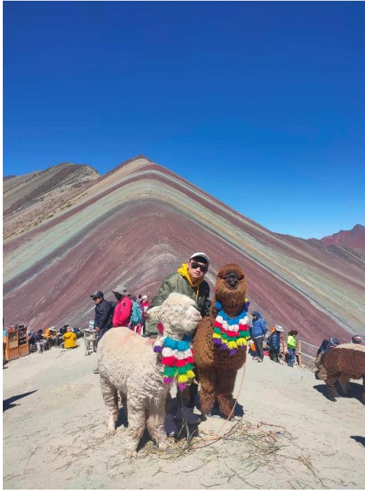
爬到快死的彩虹山