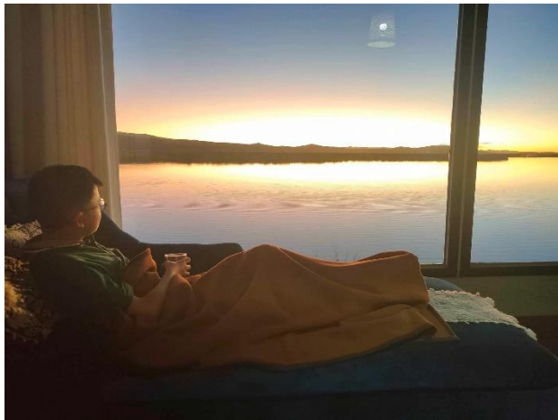
海拔最高的湖泊的的喀喀湖

祕魯我總共去了庫斯科、伊卡和的的喀喀湖。如果要去馬丘比丘記得不要去參加那種團包的旅行團，價格比自己購票、買火車票上去還要貴大概三倍。還有祕魯整體海拔偏高，記得不要逞能，一定要吃高山症的藥，不然真的會生不如死。