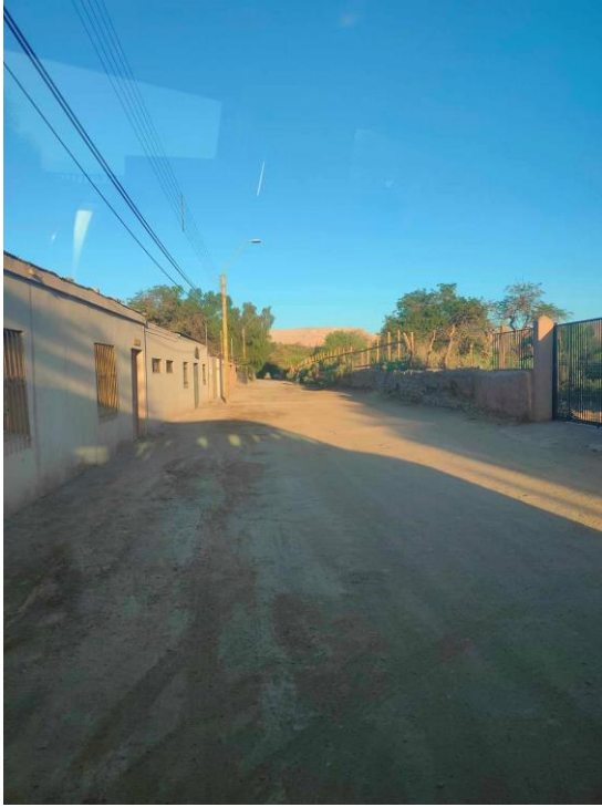
很可愛的沙漠小鄉村，聽說一年幾乎沒有一場雨