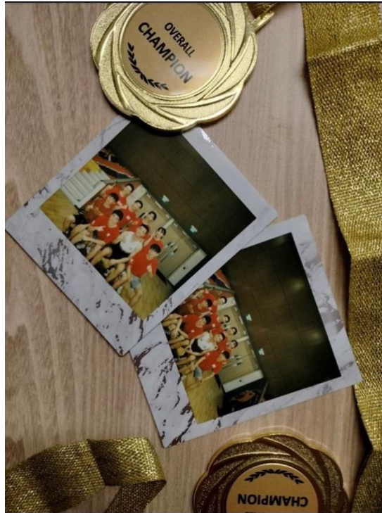
參加 BIZ 對 COM 的運動競賽