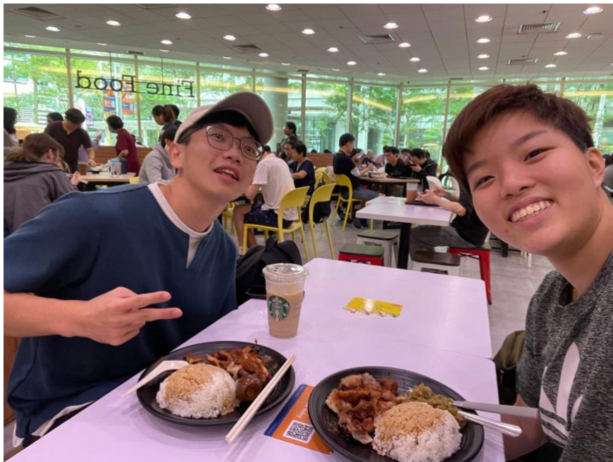
在 U-TOWN 第一次跟我的 Buddy 吃飯

新加坡大學在開學大概一週前，會寄信詢問是否需要 buddy，建議大家可以申請，運氣好的話可以遇到人很好的夥伴，一起帶你認識學校跟新加坡，讓剛去陌生地的交換生多了一份安全感。