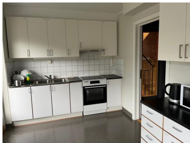
SIO 在 Sogn 的房間和 6 人共用廚房