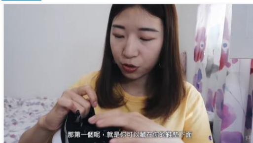
歐洲旅遊防盜藏錢的各種建議 (哎，我也被偷了)