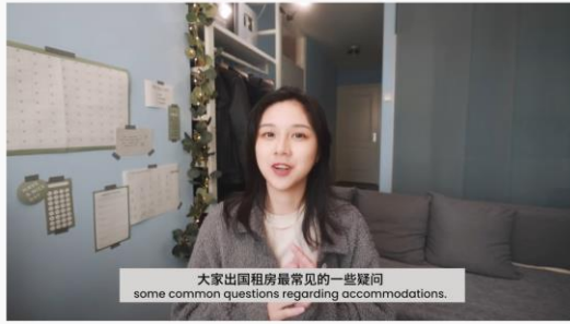
#2021留學 #留學準備 #留學租房 留學租房攻略 | 出國前怎麼準備租房？和情侶合租？| 必知注意事項 觀看次數：29,531次 · 2021年7月4日