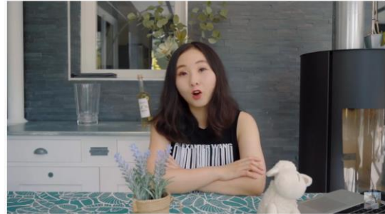
#法國租房 #法國留學 #巴黎小胡桃 法國租房不要再被坑了！12年租房辛酸史 · 我的巴黎租房指南 | 巴黎小胡桃 觀看次數：2,119次 · 2020年7月14日