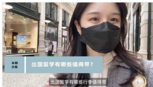
留学生行李清单 | 学姐的建议 & 收拾行李核心 tips