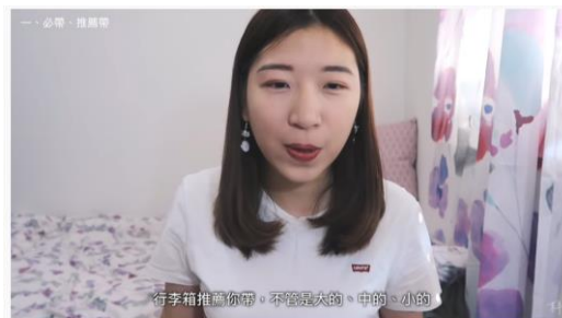
歐美交換、留學生該帶什麼? | 必帶+不必帶建議