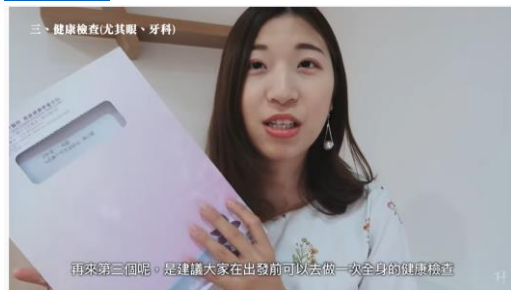
赴歐洲留學、交換的行前準備 | 出國讀書前的小建議